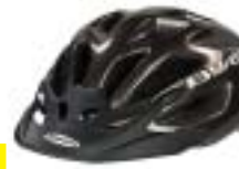
Prophete 15 Euro

Schwierige Kopfbandverstellung. Schlechteste Passform im Test. Druckstellen im Schläfenbereich. Leicht. Gute Belüftung, kein Insektenchutz. Visier schränkt das Sichtfeld ein.