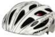
Alpina Mythos 80 Euro

Sportlicher Helm ohne Visier. Befriedigende Belüftung, mit Insektenschutz. Anpassen der Riemenfixierer schwergängig.