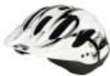
KED Neo Visor 75 Euro

Leichtester Helm im Test. Tragekomfort durch Druckstellen an den Schläfen und verrutschende Pads am Schloss gemindert. Tragen einer Brille erschwert.