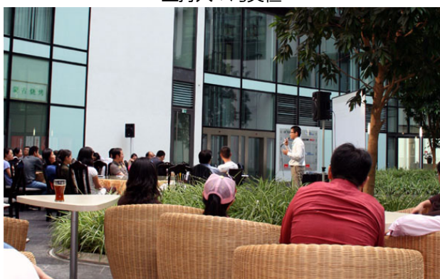
CCC I 会议现场

CC协会通过CCC I抛砖引玉，迅速在其网上论坛( www.0049cc.org )引起许多值得讨论与思考的话题：从个人理财到国家经济政策，从行业分析报告到人事猎头信息，相信CC协会不日即会集中众多的兴趣话题，再次与朋友们零距离分享，也将为志同道合的朋友创造结识更多华人精英的机会。