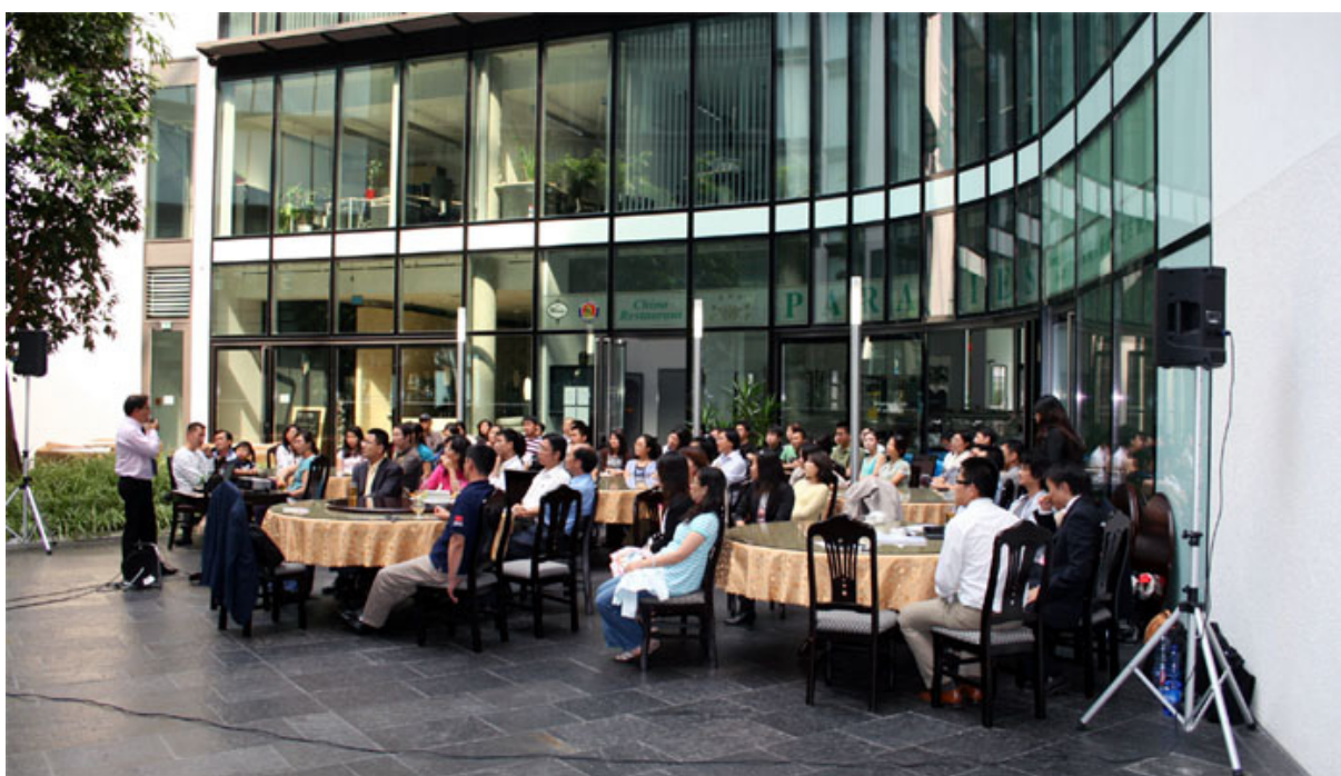
CCC I 会议现场

8 月 22 日下午，90 位志同道合的同仁在法兰克福汇聚一堂参与并圆满完成了 CC 协会的主题探讨性活动 Chinese Competence Conference I (CCC I) 投资与金融业报告讨论会。（ 详细内容 ）