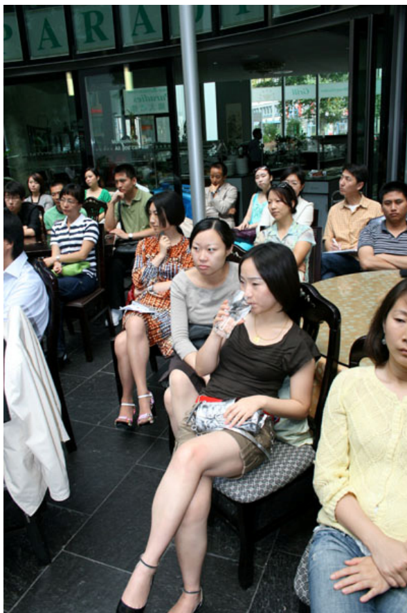
CCC I 会议现场